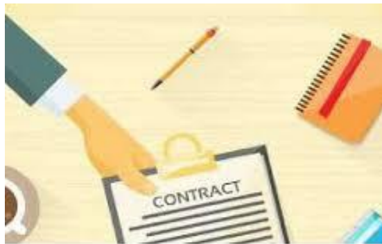
5 Things To Keep In Mind While Drafting Your Very First Contract